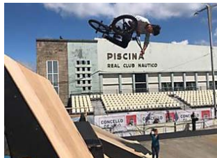
¿Qué tiempo hará en O Marisquiño?