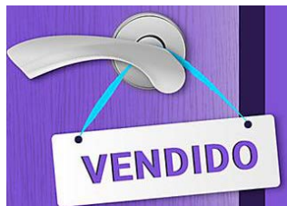
Vende tu casa entre particulares y ahórrate las comisiones. Housell