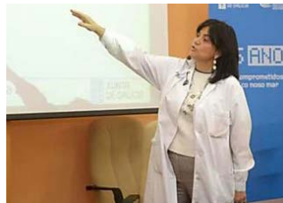
Una inusual presencia de tres biotoxinas a la vez afecta a bateas de mejillón y bancos marisqueros