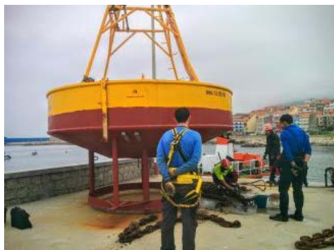
Traballos de mantemento na Guarda. // Divulgar

O documento, que se inscribe no marco do proxecto MarRisk, resume as operacións de fondeo de abóiaa, que pertence ao observatorio RAIA. Unha acción rutineira que se realiza cada un ou dous anos.