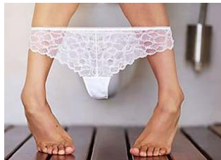
Estos son los peligros del baño de vapor vaginal, la nueva moda entre las famosas