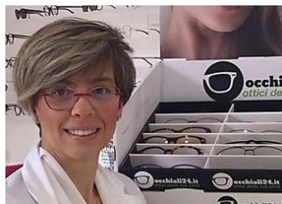
Gafas progresivas de alta gama por solo 319€ en vez de más de 800€ gafas.es